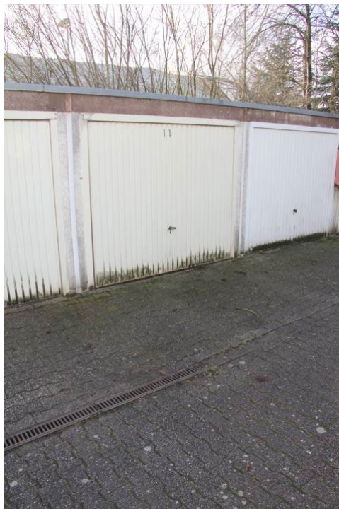
Garage zur Wohnung